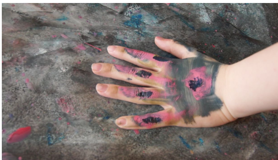
Performance art ved Donna

KUNST UNDERVISNING MED SPESIALKLASSE FRA SKOLE I OSLO MAI 2014